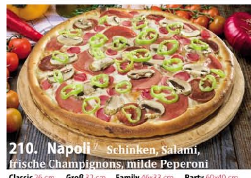
210. Napoli 2,5,6,7 A, G.L. Schinken, Salami, frische Champignons, milde Peperoni Classic 0,26 € 8,50 Groß 0,32 € 11,40 Family 0,46x33 € 17,95 Party 0,60x40 € 22,95