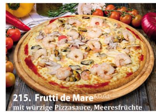
215. Frutti de Mare A, D, G.L. mit würzige Pizzasauce, Meeresfrüchte Classic 0,26 € 8,50 Groß 0,32 € 11,40 Family 0,46x33 € 18,95 Party 0,60x40 € 22,95