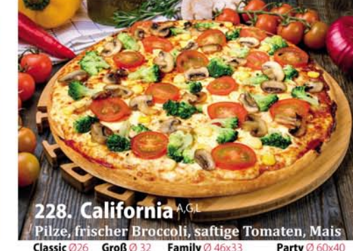
228. California A, G.L. Pilze, frischer Broccoli, saftige Tomaten, Mais Classic 0,26 € 7,99 Groß 0,32 € 10,40 Family 0,46x33 € 17,95 Party 0,60x40 € 22,95