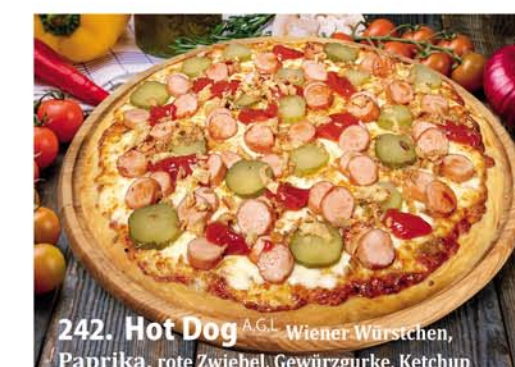
242. Hot Dog A, G.L. Wiener Würstchen, Paprika, rote Zwiebel, Gewürzgurke, Ketchup Classic 0,26 € 8,50 Groß 0,32 € 11,40 Family 0,46x33 € 18,95 Party 0,60x40 € 22,95