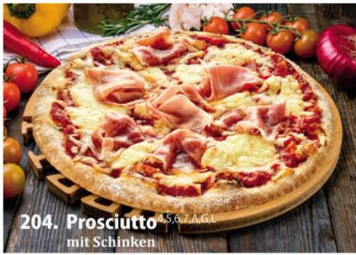
204. Prosciutto 4,5,6,7 A, G.L. mit Schinken Classic 0,26 € 6,90 Groß 0,32 € 9,40 Family 0,46x33 € 17,95 Party 0,60x40 € 21,95