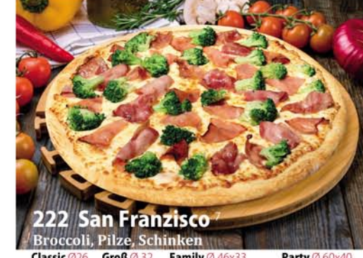
222. San Francisco Broccoli, Pilze, Schinken Classic 0,26 € 8,40 Groß 0,32 € 11,40 Family 0,46x33 € 18,95 Party 0,60x40 € 22,95