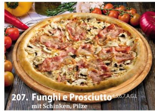
207. Funghi e Prosciutto 2,5,6,7 A, G.L. mit Schinken, Pilze Classic 0,26 € 7,50 Groß 0,32 € 10,40 Family 0,46x33 € 18,95 Party 0,60x40 € 22,95