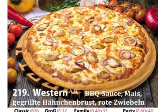
219. Western A, G.L. BBQ-Sauce, Mais, gegrillte Hähnchenbrust, rote Zwiebeln Classic 0,26 € 6,90 Groß 0,32 € 9,40 Family 0,46x33 € 17,95 Party 0,60x40 € 21,95