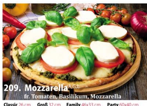
209. Mozzarella 4,5,6,7 A, G.L. fr. Tomaten, Basilikum, Mozzarella Classic 0,26 € 7,50 Groß 0,32 € 10,40 Family 0,46x33 € 18,95 Party 0,60x40 € 22,95