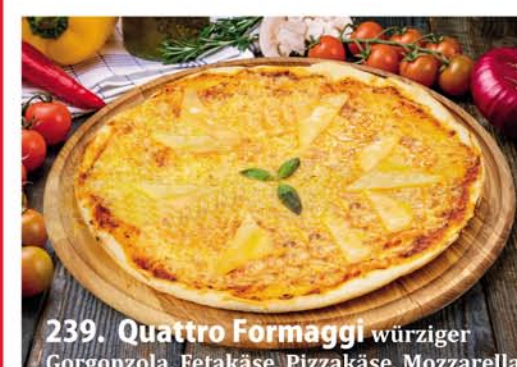
239. Quattro Formaggi würziger Gorgonzola, Fetakäse, Pizzakäse, Mozzarella Classic 0,26 € 8,90 Groß 0,32 € 11,40 Family 0,46x33 € 18,95 Party 0,60x40 € 22,95