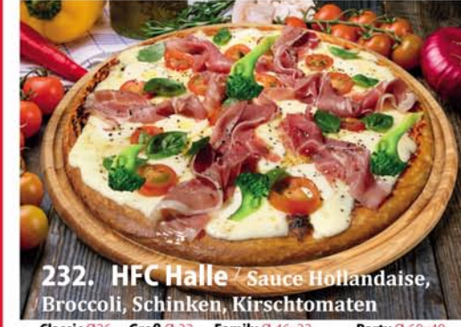
232. HFC Halle Sauce Hollandaise, Broccoli, Schinken, Kirschtomaten Classic 0,26 € 8,50 Groß 0,32 € 11,40 Family 0,46x33 € 18,95 Party 0,60x40 € 22,95