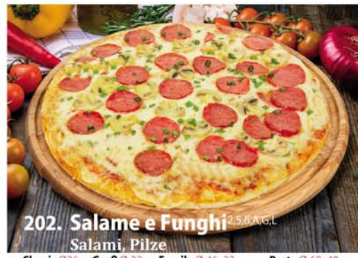
202. Salame e Funghi 2,5,6 A, G.L. Salami, Pilze Classic 0,26 € 7,50 Groß 0,32 € 10,40 Family 0,46x33 € 18,95 Party 0,60x40 € 22,95