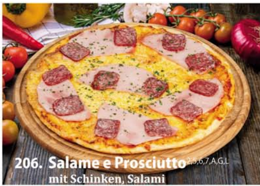
206. Salame e Prosciutto 2,5,6,7 A, G.L. mit Schinken, Salami Classic 0,26 € 7,50 Groß 0,32 € 10,40 Family 0,46x33 € 18,95 Party 0,60x40 € 22,95