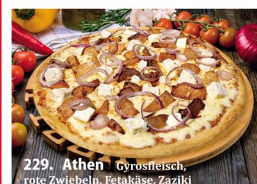
229. Athen Gyrosfleisch, rote Zwiebeln, Fetakäse, Zaziki Classic 0,26 € 7,90 Groß 0,32 € 10,40 Family 0,46x33 € 18,95 Party 0,60x40 € 22,95