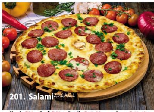
201. Salami 2,5,6,7 A, G.L. Classic 0,26 € 6,90 Groß 0,32 € 9,40 Family 0,46x33 € 17,95 Party 0,60x40 € 21,95