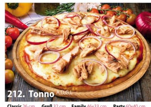
212. Tonno A, D, G.L. Classic 0,26 € 8,20 Groß 0,32 € 10,40 Family 0,46x33 € 17,95 Party 0,60x40 € 22,95