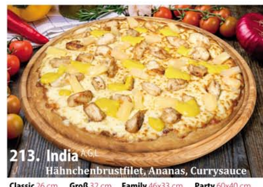
213. India G.L. Hähnchenbrustfilet, Ananas, Currysauce Classic 0,26 € 8,50 Groß 0,32 € 11,40 Family 0,46x33 € 18,95 Party 0,60x40 € 22,95