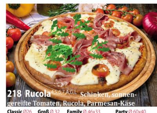
218. Rucola 2,5,6,7 A, G.L. Schinken, sonnengereifte Tomaten, Rucola, Parmesan-Käse Classic 0,26 € 6,90 Groß 0,32 € 9,40 Family 0,46x33 € 17,95 Party 0,60x40 € 21,95