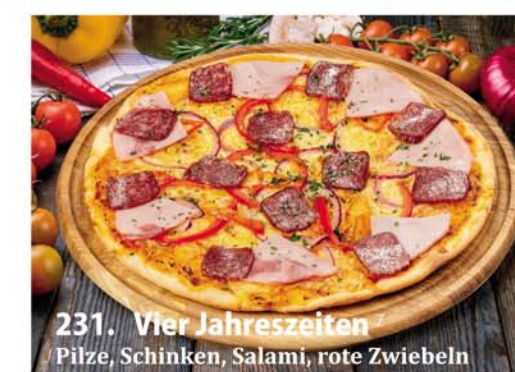
231. Vier Jahreszeiten Pilze, Schinken, Salami, rote Zwiebeln Classic 0,26 € 8,50 Groß 0,32 € 11,40 Family 0,46x33 € 18,95 Party 0,60x40 € 22,95