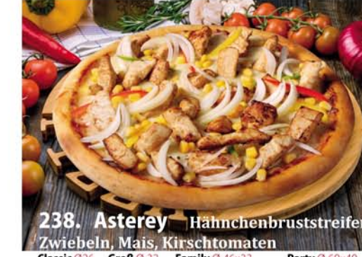
238. Asterey Hähnchenbruststreifen, Zwiebeln, Mais, Kirschtomaten Classic 0,26 € 8,50 Groß 0,32 € 11,40 Family 0,46x33 € 18,95 Party 0,60x40 € 22,95