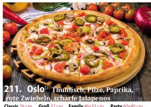
211. Oslo D Thunfisch, Pilze, Paprika, rote Zwiebeln, scharfe Jalapenos Classic 0,26 € 8,50 Groß 0,32 € 11,40 Family 0,46x33 € 18,95 Party 0,60x40 € 23,95