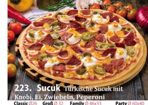
223. Sucuk A, G.L. Türkische Sucuk mit Knöbli, Ei, Zwiebeln, Peperoni Classic 0,26 € 8,90 Groß 0,32 € 11,40 Family 0,46x33 € 18,95 Party 0,60x40 € 22,95