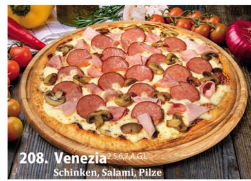
208. Venezia 2,5,6,7 A, G.L. Schinken, Salami, Pilze Classic 0,26 € 7,50 Groß 0,32 € 10,40 Family 0,46x33 € 18,95 Party 0,60x40 € 22,95